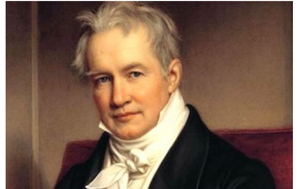
Alexander von Humboldt (1789-1859).

La deriva dei continenti = la dérive des continents La desertificazione = la désertification