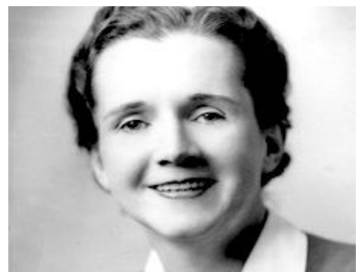
Rachel Carson (1907-1964), biologiste et écologiste.