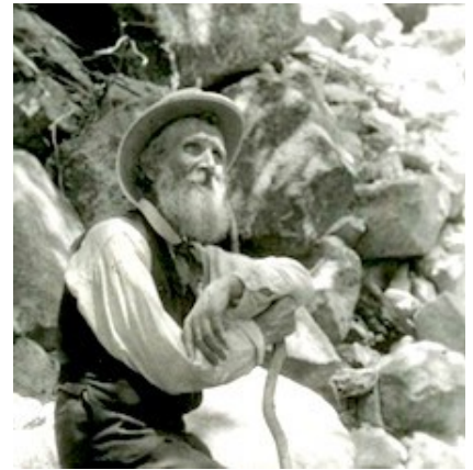
John Muir Cane (1838-1914), naturaliste.

L' ebollizione = l'ébullition L' ecografia = l'échographie L' elettròlisi = l'électrolyse L' emoglobina = l'hémoglobine L' enzima = l'enzyme L' ermafrodita = l'hermaphrodite L' evoluzione = l'évolution Il fagocita = le phagocyte La famiglia = la famille Il faraday = le faraday La fecondazione = la fécondation La fermentazione = la fermentation La filtrazione = la filtration La fisiologia = la physiologie Il gas = le gaz Il gene = le gène La genealogia = la généalogie Il genere = le genre La ghiandola = la glande La glicolisi = la glycolyse Il guscio = la coquille L' humus = l'humus L' ibridazione = l'hybridation L' idratazione = l'hydratation Idròfilo = hydrophile // idròfobo = hydrophobe L' idròlisi = l'hydrolyse L' immunità = l'immunité L' impollinazione = la pollinisation L' incubatore = l'incubateur Lo joule = le joule La legge = la loi La malattia = la maladie Il metabolismo = le métabolisme Il microscòpio = le microscope La nomenclatura = la nomenclature L' oligoelemento = l'oligoélément L' osmòsi = l'osmose La pianta = la plante La riproduzione = la reproduction La sindrome = le syndrome La specie allòctona = l'espèce allochtone // la specie autòctona = l'espèce autochtone La tassonomia = la taxonomie La vaccinazione = la vaccination