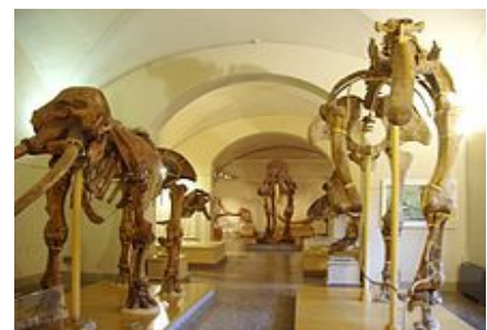
Museo di storia naturale di Firenze, sala si paleontologia.

La botànica = la botanique < grec = art de soigner les plantes