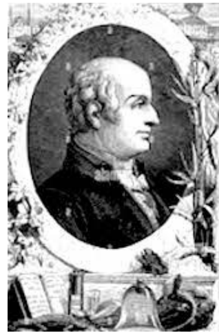
Lazzaro Spallanzani (1729-1799), zoologo Pavia.