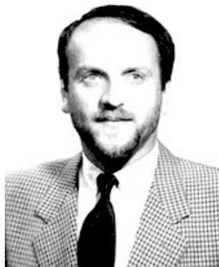
Edoardo Ronchi (1950- ), Ministro ambientalista Verde.