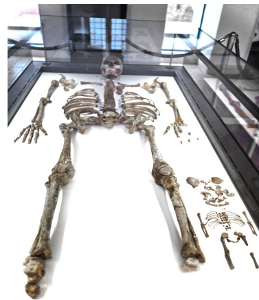
Museo di Civiltà Preclassiche di Ostuni (Puglia), La madre più antica del mondo (- 28.000 anni).