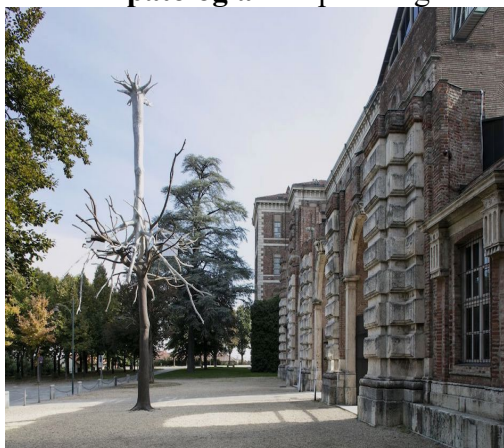
Giuseppe Penone, Identità, 2017, Castello di Rivoli (Piemonte).