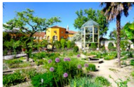
Orto botanico di Padova.