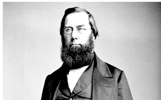
George Perkins Marsh (1801-1882), premier écologiste américain.