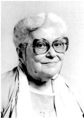
Laura Conti (191-1993), ambientalista.