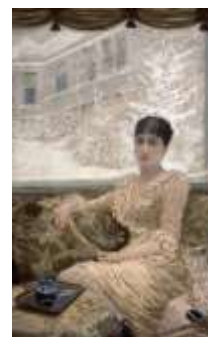
De Nittis, Che freddo, 1874, Musée Goupil, Paris ; Place des Pyramides, Musée d'Orsay, 1875 ; La pattinatrice (Léontine che pattina), 1875, Dunkerque ; Giornata d'inverno (Ritratto di Léontine), 1882, Barletta.