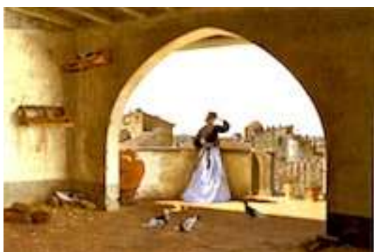
Odoardo Borrani , Carro rosso a Castiglioncello , 1865 ; Vincenzo Cabianca , Marmi a Carrara Marittima , 1861 ; Odoardo Borrani , La terrazza , 1865