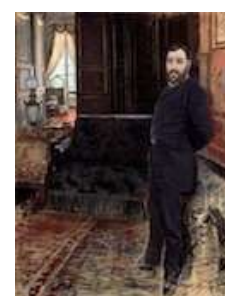
De Nittis , Autoportrait , 1883