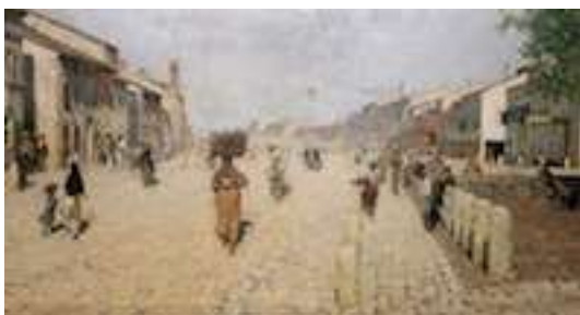
Signorini, Porta Adriana a Ravenna - 1875 - Roma

volere del padre, sotto la cui guida iniziò la sua formazione pittorica. Nel 1852 si iscrisse all' Accademia di Belle Arti , anche se seguì svogliatamente i suoi corsi: nel suo animo, infatti, sorse ben presto una naturale insofferenza alle rigidità