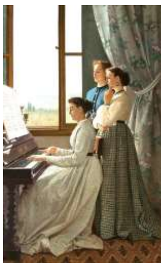
Silvestro Lega , Il canto dello stornello , 1867.