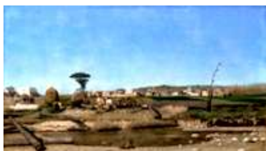
De Nittis , Un casale nei dintorni di Napoli , 1866 – Napoli, Museo di Capodimonte.

Giuseppe De Nittis , invece viene dal Sud, dalle Puglie (Barletta). Nato nel 1846, era figlio di un ricco proprietario terriero arrestato per ragioni politiche (era liberale) e si suicidò appena uscito di prigione; fu dunque educato dai nonni materni, e imparò il disegno e la pittura presso