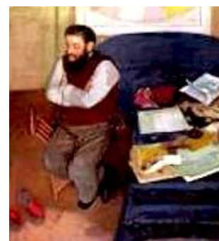
Fattori, La Signora Martelli a Castiglioncello ; Ritratto della terza moglie , 1905 ; Diego Martelli .

Uno degli ultimi quadri del 1880 è Lo staffato (= Le soldat démonté - Palazzo Pitti) : Il dipinto rappresenta una scena di cruda realtà in movimento. Il cavallo, forse spaventato da un qualcosa di esterno - si suppone uno sparo - si lancia in un galoppo furioso trascinandosi dietro per terra il suo povero cavaliere che è rimasto impigliato con un piede sulla staffa ; a giudicare dall'abito militare e dalla scia di sangue che questi lascia, si può facilmente supporre che sia un soldato che è appena stato ucciso da un nemico. Per via del periodo in cui venne eseguito e per la militanza di Fattori nelle guerre per l' unità d'Italia , il dipinto può essere letto come un'allegoria della fine del Risorgimento e delle guerre dette spesso « eroiche » che l'avevano contraddistinto. La morte ora è rappresentata non più eroicamente nel mezzo di una battaglia né come finalizzata ad un ideale, ma nella freddezza di una giornata grigia e solitaria, e senza punti di riferimento ; persino il cavallo pare lanciarsi dritto dinanzi a sé oltre la curva, come a dire che il futuro non è poi così certo e sicuro come i patrioti l'avevano immaginato. Anche il paesaggio è desolato e spoglio, sottolineando la sostanziale indifferenza della Natura nei confronti delle vicende umane.