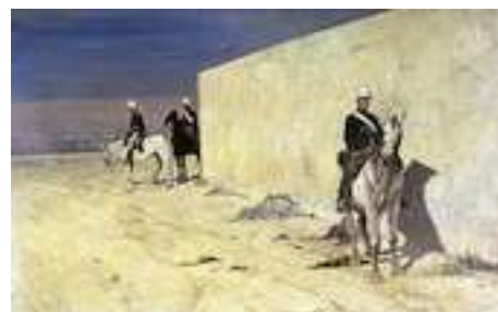
Fattori, In vedetta, 1872. Sotto : La carica dei Piemontesi alla battaglia della Sforzesca, 1880

Nel 1867, la moglie di Fattori morì di tubercolosi, e il pittore, accostatosi alla scuola di Castiglioncello e a Diego Martelli , creò allora una serie di opere che indagavano gli aspetti più concreti e quotidiani della realtà : scene di guerra ( Assalto alla Madonna della Scoperta, un episodio della battaglia di San Martino, 24 giugno 1859, 1868 ; In vedetta, 1872, Valdarno ; La carica della cavalleria piemontese alla battaglia della Sforzesca (21 marzo 1849), 1880 ) e scene di vita e di logorio del lavoro contadino ( Raccolta del fieno in Maremma, 1867-72 ; Barrocci romani, 1873, Palazzo Pitti, dove 4 cavalli esausti si riposano davanti a un lungo muro che taglia l'orizzonte ; Terreno paludoso, 1894 ; Il riposo, 1887 ). Continua a dipingere la vita della borghesia ( La Rotonda dei Bagni di Palmieri, 1866 : sul lungomare di Livorno, sotto il tendone, sette donne borghesi sono all'ombra con cappellini e gonne lunghe ) e paesaggi di Maremma toscana, la sua terra ( Libeccciata, 1885, dove soffia il libeccio creando colori freddi ; Cavalli al pascolo ; Paesaggio livornese ). Un tema fondamentale della poetica fattoriana è quello dei contadini e dei loro costumi: i butteri , la gente del popolo e il loro faticoso lavoro dei campi, la vita degli animali e il logorio del lavoro sono tutti dati stilistici che troviamo