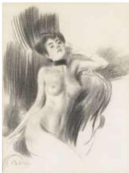
Boldini , Donna nuda seduta, un natro rosso intorno al collo – Non datato. Paesaggio con pino marittimo , 1915-16 - Ferrara