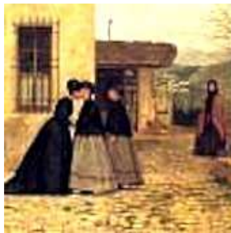
Silvestro Lega , Una visita , 1868