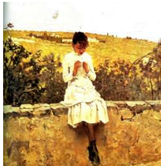
Signorini, Sulle colline a Settignano , 1885.

Un viaggio molto importante per la sua arte fu quello che fece con Vincenzo Cabianca a La Spezia, dove visitò i borghi di Pitelli, San Terenzo, Vezzano Ligure, Lerici, Sarzana, Riomaggiore e la costa delle Cinque Terre nella prospettiva di dare un nuovo impulso alla propria pittura, dotandola di vigorosi contrasti tra le luci e le ombre, in grado di definire la macchia di colore come l'elemento costitutivo della sua opera.