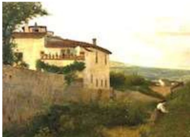
Silvestro Lega , Una veduta di Piagentina

1845, passò dunque nello studio del pittore purista Luigi Mussini (1813-1888), si arruolò negli eserciti rivoluzionari nel 1848, e, tornato a Firenze, frequentò il Caffè Michelangelo , pur non parteggiando gli scherzi e l'atteggiamento gogliardico dei presenti. Le sue frizioni coi macchiaioli lo allontanarono da Firenze e si rifugiò a Modigliana, in Romagna dov'era nato, diventò socio dell' Accademia degli Incamminati , e vi dipinse numerosi ritratti e scene di guerra patriottica (Cf. Il ritorno di bersaglieri , Ritratto di Garibaldi , sopra, 1861). Nel 1860, inizia ricerche pittoriche en plein air e promuove, con Telemaco Signorini , Giuseppe Abbati , Odoardo Borrani e Raffaello Sernesi , la nascita della scuola di Piagentina ,