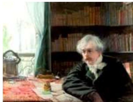
De Nittis, Ritratto di Edmond de Goncourt, 1881, Nancy.

L'esposizione della sua opera nella Mostra del 1878 a Parigi gli valse la Legione d'Onore. Realizzò molti ritratti, circondato da molte personalità parigine, Manet, Degas, i fratelli