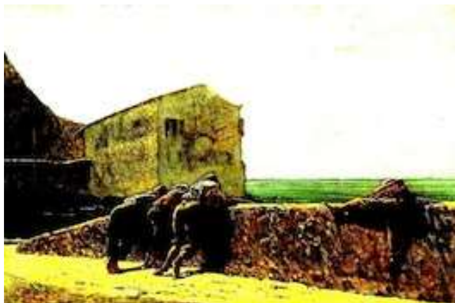
Telemaco Signorini , Giovani pescatori , 1866 – Galery Berman