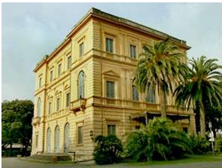
Villa Mimbelli a Livorno, Museo Civico Fattori, e statua di Fattori