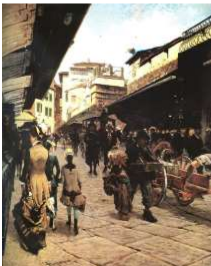
Signorini, Ponte Vecchio a Firenze – 1880.

Nel 1855 iniziò a partecipare ai festosi e turbolenti incontri del Caffè Michelangelo , proprio nell'anno in cui Francesco Saverio Altamura sperimentava le novità della macchia. Totalmente immerso nella sua vocazione e in una profonda inquietudine creativa, Signorini in questo periodo viaggiò parecchio. Dopo aver compiuto nel 1856 un viaggio di studio a Venezia in compagnia di Vito d'Ancona si sarebbe recato in Emilia Romagna, in Lombardia, in Piemonte, sui laghi, nuovamente a Venezia, a Ferrara, arrivando nel 1859 persino ad arruolarsi per un anno come volontario dell'esercito garibaldino.