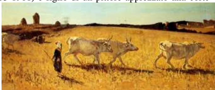
Telemaco Signorini, Pascoli a Castiglioncello, 1861

volere del padre, sotto la cui guida iniziò la sua formazione pittorica. Nel 1852 si iscrisse all' Accademia di Belle Arti , anche se seguì svogliatamente i suoi corsi: nel suo animo, infatti, sorse ben presto una naturale insofferenza alle rigidità