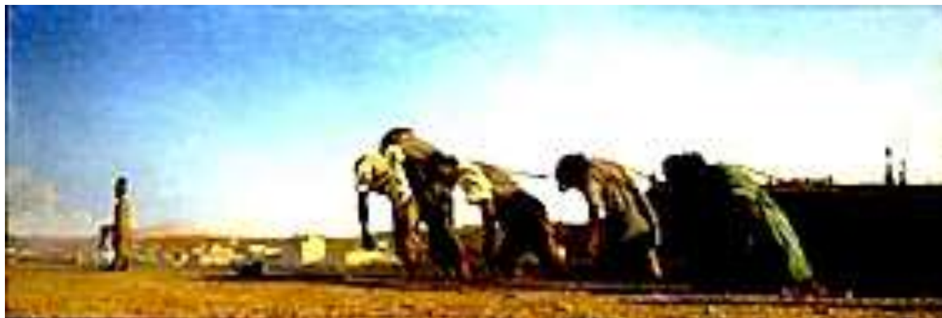
Telemaco Signorini, L'Alzaia , (Le chemin de halage), 1864, Collection privée anglaise

Torino - Nella tersa luce del giorno, si stagliano le figure robuste ma barcollanti di cinque uomini che stanno rimorchiando un'imbarcazione dalla sponda dell'Arno. In maniche di camicia, i pantaloni arrotolati al polpaccio, le schiene si inarcano sotto lo sforzo, le braccia si piegano ad asciugare il sudore dai volti, i piedi sembrano inchiodati a terra dalla fatica. L'effetto di controluce accentua i contorni e riduce a macchie scure i visi, mentre sullo sfondo si delinea il