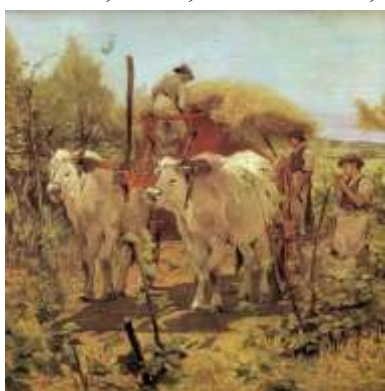
Fattori, Raccolta del fieno in Maremma, 1867-72. Sotto : Barrocci romani, 1873 ; A destra : Terreno paludoso, 1894 ; Il riposo, 1887 ; I butteri, 1893

romani, 1873, Palazzo Pitti, dove 4 cavalli esausti si riposano davanti a un lungo muro che taglia l'orizzonte ; Terreno paludoso, 1894 ; Il riposo, 1887 ). Continua a dipingere la vita della borghesia ( La Rotonda dei Bagni di Palmieri, 1866 : sul lungomare di Livorno, sotto il tendone, sette donne borghesi sono all'ombra con cappellini e gonne lunghe ) e paesaggi di Maremma toscana, la sua terra ( Libeccciata, 1885, dove soffia il libeccio creando colori freddi ; Cavalli al pascolo ; Paesaggio livornese ). Un tema fondamentale della poetica fattoriana è quello dei contadini e dei loro costumi: i butteri , la gente del popolo e il loro faticoso lavoro dei campi, la vita degli animali e il logorio del lavoro sono tutti dati stilistici che troviamo