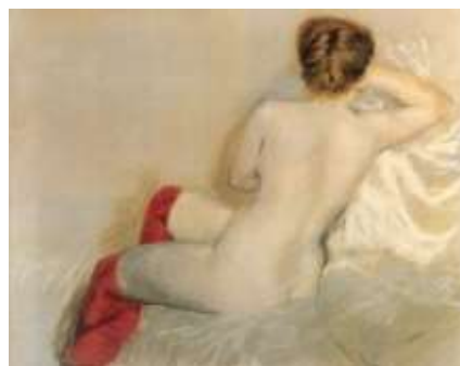
De Nittis, Nudo con calze rosse, 1879 ; La strada da Brindisi a Barletta, non datato.