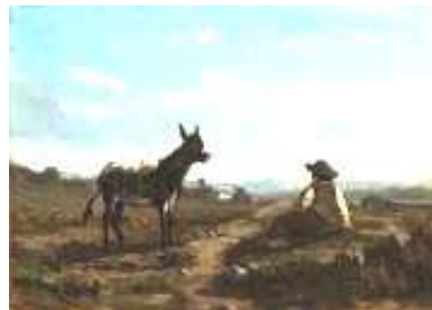
Serafino De Tivoli, Contadinello e ciuchino , Non datato

E che dire delle giornate all'aria aperta, trascorse a studiare gli effetti di luce prodotti da un bucato steso, da un branco di pecore e da un gruppo di cipressi sulla collina. Non furono forse loro i primi ad uscire fuori dall'atelier, a cercare una presa diretta del paesaggio, magari per un prelievo abbozzato e istintivo della realtà, da completare in studio. Senza dimenticare i « ritratti », completamente reinterpretati attraverso un'indagine emotiva e somatica del personaggio. E la quotidianità della vita, scandita da scene domestiche, intimità delle stanze e il calore dei semplici gesti. Perché, poi, proprio Firenze e la Toscana ad infiammare una simile rivoluzione artistica, lo rivelano le singolari coincidenze di questa terra. Il regime tollerante del granducato di Toscana costituì un rifugio per gli esuli dei moti del '48. Giungevano da Napoli il pugliese Saverio Altamura e Domenico Morelli , che portavano con loro le esperienze di pittura dal vero dei fratelli Palazzi . Da Milano, Domenico Induno (1815-1878), dopo la difesa di Roma, Serafino De Tivoli (1826-1892). Tutti artisti che s'erano incontrati sulle barricate e sui campi di battaglia, tutti ferventi patrioti repubblicani e garibaldini, di idee laiche e progressiste, mazziniani socialisti, come Telemaco Signorini , o simpatizzanti anarchici come Silvestro Lega e Diego Martelli .