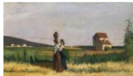
Fattori, Libecciate , 1885 ; Cavalli al pascolo ; Paesaggio livornese .