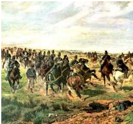
Fattori, Assalto alla Madonna della Scoperta, 1862, dettaglio..

sensazione di staticità, compromessa tuttavia dalla dinamicità di altri elementi (come i cavalli), utili a trasmettere all'osservatore la tensione dello scontro. La profondità del paesaggio è invece resa con la posizione degli alberi, gli unici elementi pienamente verticali della tela. Dal punto di vista stilistico il quadro non può dirsi ancora pienamente macchiaiolo : seppur il colore sia già applicato sulla tela con estese campiture orizzontali, i volumi e le lontananze non sono resi con la macchia , bensì con il chiaroscuro tradizionale. Si tratta, insomma, di uno stile che fonde armoniosamente le regole accademiche con la nascente arte macchiaiola .