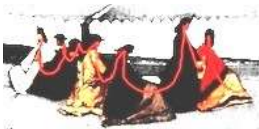
Fattori, La Rotonda dei Bagni di Palmieri , 1866 ; connessione tra le 7 donne.