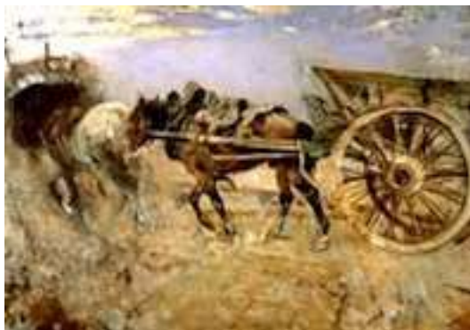
Boldini , Cavalli al tombarello (tombereau), 1885-Firenze Palazzo Pitti.