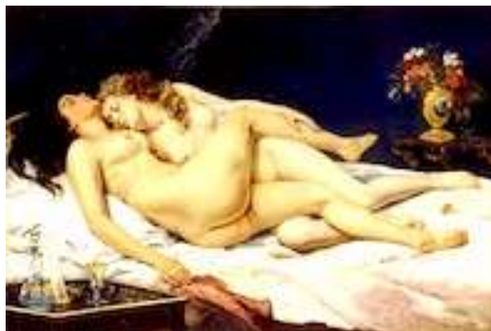
Gustave Courbet , Le sommeil (Paresse et luxure) , 1866, Paris Petit Palais.

Un incontro di figure, di una composta eleganza fatta di abiti sobri dalle tinte pacate sui quali spiccano i castigati colletti bianchi sullo sfondo di muro dalla calda tonalità dorata. Ma la genialità narrativa sta tutta in quelle tonalità evocative di vibrazioni luminose che raccontano il tepore di quel pomeriggio soleggiato, ma non terso.