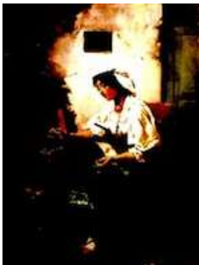
Domenico Induno , La ragazza che cuce , non datato, Milano

Piagentina, la mostra va avanti a raggruppamenti tematici, dal debutto della « macchia » tra tiepide sperimentazioni e azzardi cromatici, si passa a possibili generi, come il paesaggio, la sfera del quotidiano con l'intimità delle scene domestiche, gli intenti realistici, dove ogni sezione diventa una piccola ma sapiente collettiva. Quasi un dibattito a più voci su un argomento di svolta.