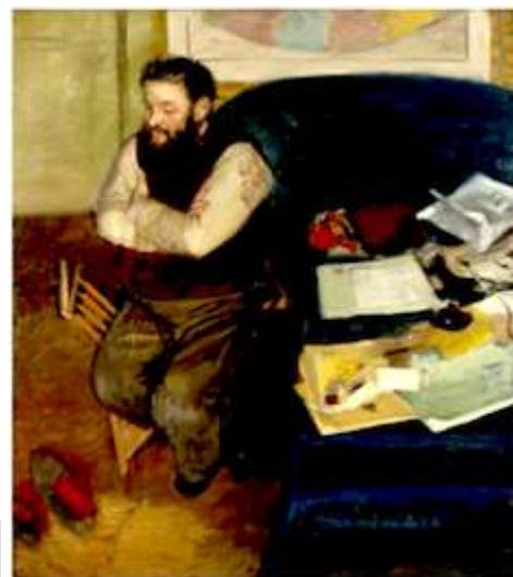
Edgard Degas, Portrait de Diego Martelli, 1879 -Écosse

Bandito il chiaroscuro, gli artisti procedevano per accostamenti di colore, costruendo effetti d'ombra e di luce senza far uso del nero. Risultato : inediti effetti di grande luminosità e resa atmosferica, che passavano anche per una semplificazione dello scenario nelle linee essenziali. Con una smalzata disinvoltura, tra i pittori vigeva la tecnica della pennellata abbreviata, veloce, impulsiva, che registrava sulle tela alla bell'e buona l'impressione dell'immagine. Ed è per questo che si vuole intravedere in questa estetica un primato del gruppo fiorentino sui colleghi francesi. Non furono forse i macchiaioli a sfoggiare per primi un