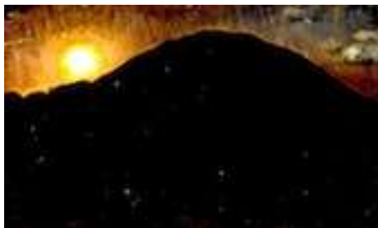
De Nittis, Il passaggio degli Appennini (Diligenza per tempo di pioggia), 1867 – Capodimonte, Napoli ; Alba sul Vesuvio, 1872.