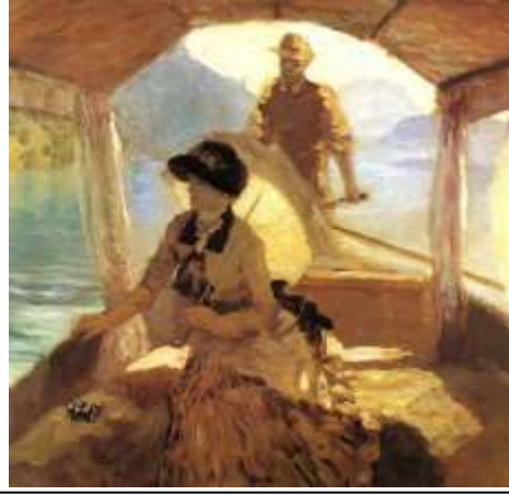
De Nittis, Colazione in giardino (Déjeuner au jardin) , 1883, Barletta ; Sul lago dei Quattro Cantoni (Svizzera) , dettaglio, 1881.