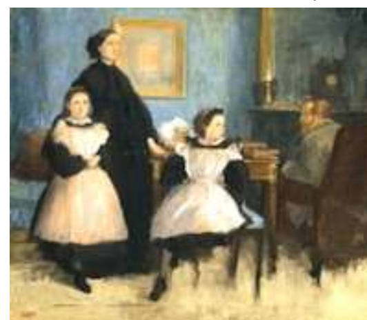
Edgard Degas, La famiglia Bellelli , 1858 - Danemark