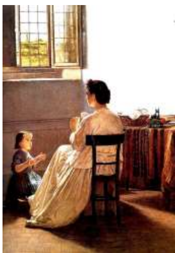
Silvestro Lega , L'educazione al lavoro .1863

fusione tonale di luce e colore.. Dopo alcune esposizioni è depresso dalla morte della moglie e da problemi agli occhi Muore nel 1895 a Firenze.