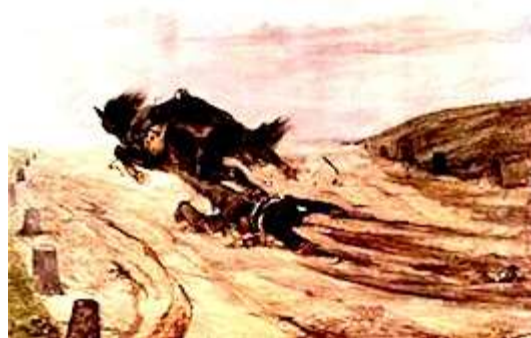
Fattori, Lo staffato = le soldat démonté, 1880.

Uno degli ultimi quadri del 1880 è Lo staffato (= Le soldat démonté - Palazzo Pitti) : Il dipinto rappresenta una scena di cruda realtà in movimento. Il cavallo, forse spaventato da un qualcosa di esterno - si suppone uno sparo - si lancia in un galoppo furioso trascinandosi dietro per terra il suo povero cavaliere che è rimasto impigliato con un piede sulla staffa ; a giudicare dall'abito militare e dalla scia di sangue che questi lascia, si può facilmente supporre che sia un soldato che è appena stato ucciso da un nemico. Per via del periodo in cui venne eseguito e per la militanza di Fattori nelle guerre per l' unità d'Italia , il dipinto può essere letto come un'allegoria della fine del Risorgimento e delle guerre dette spesso « eroiche » che l'avevano contraddistinto. La morte ora è rappresentata non più eroicamente nel mezzo di una battaglia né come finalizzata ad un ideale, ma nella freddezza di una giornata grigia e solitaria, e senza punti di riferimento ; persino il cavallo pare lanciarsi dritto dinanzi a sé oltre la curva, come a dire che il futuro non è poi così certo e sicuro come i patrioti l'avevano immaginato. Anche il paesaggio è desolato e spoglio, sottolineando la sostanziale indifferenza della Natura nei confronti delle vicende umane.