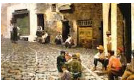
Signorini, Chiacchiere a Riomaggiore , 1893.

Nel 1861, con Cabianca e Banti , Signorini si recò a Parigi, dove strinse amicizia con Jean-Baptiste Camille Corot e Constant Troyon , si entusiasmò per il realismo di Courbet . Ritornato in Italia soggiornò per un breve periodo a Castiglioncello insieme ad altri macchiaioli per poi fondare col Lega e col Borrani la cosiddetta « scuola di Piagentina », dal nome della località fiorentina dove erano soliti dipingere all'aperto, prendendo ispirazione dalla natura e dalla sua poetica mutevolezza stagionale.