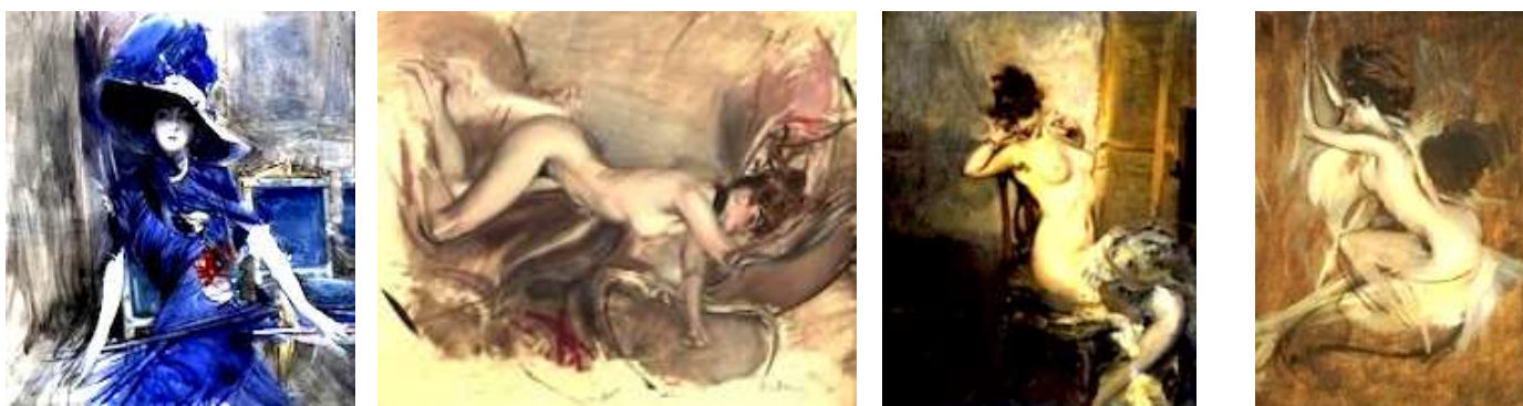
Boldini , La divina in blu , 1905 ; Nudo di donna , 1890 ; Nudo di giovane donna seduta ; Nudo femminile , 1910-1920.