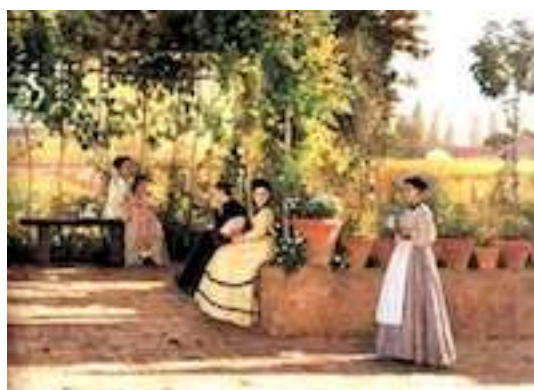
Silvestro Lega , Un dopopranzo (il pergolato) , 1868

Rifiutandosi di ritrarre re, nobili, generali, alti funzionari e cardinali, si volgeva al paesaggio, alla vita contadina e ai proprietari di quelle terre ai quali credeva dovessero affidarsi i destini economici e politici di una nuova e migliore Italia : proprietari benestanti e non necessariamente ben pensanti , attenti ai loro interessi e amanti dell'ordine ma aperti alle novità e consapevoli della necessità di una nuova moralità e di un nuovo ordine.