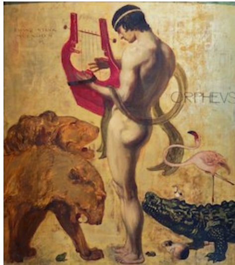
Franz von Stuck (1863-1928), Orphée charmant les bêtes sauvages - 1891, Villa Stuck