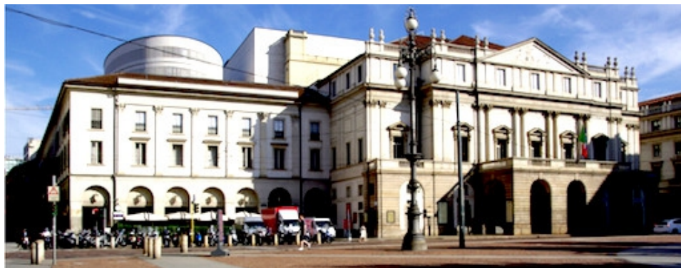
Le théâtre de la Scala à Milan.