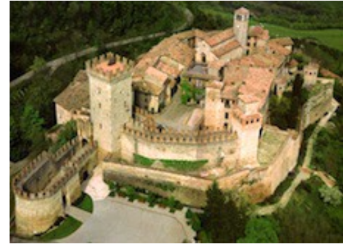
Château de Vigoleno (Prov. de Piacenza)

La strada = la route (Voir aussi les transports en 11i )