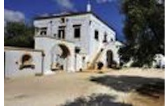
Masseria De Michele, Ostuni (Puglia)

Il castello = le château (Pour l'ensemble du vocabulaire du château, voir 9e l'architecture )