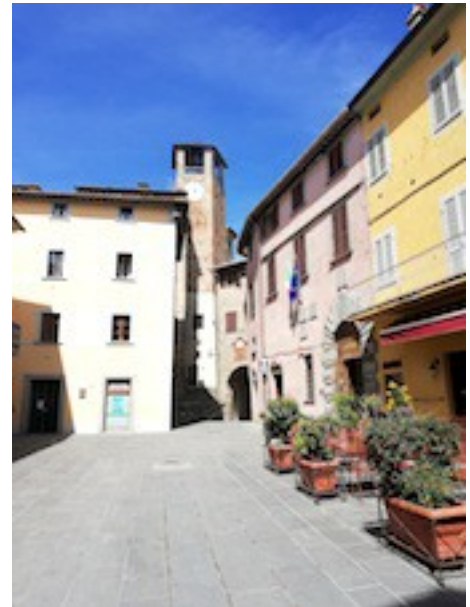
Montone (Umbria), Piazza Fortebraccio