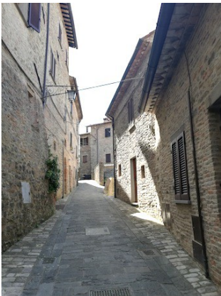
A sinistra : un viöttolo di Montone (Umbria) A destra : Piazza di San Gimignano (Toscana).

La tenuta (la dipendenza ) = la tenure (les terres que le paysan tient de son seigneur)