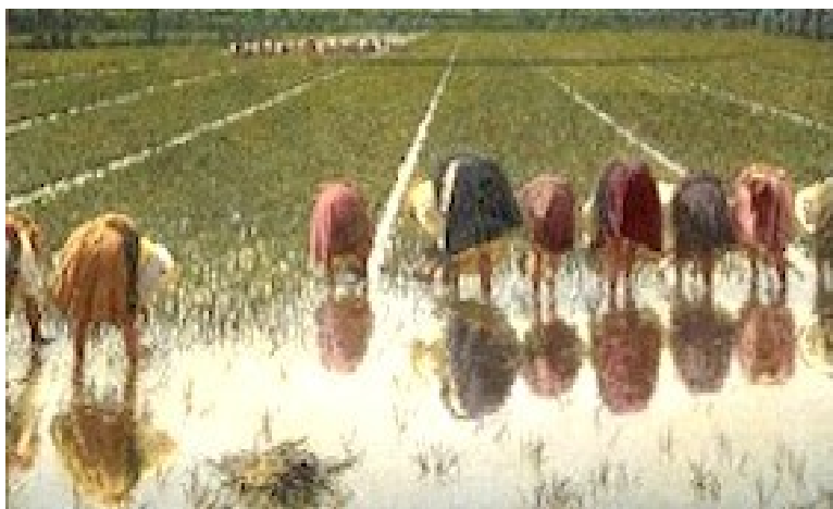
Angelo Morbelli (Alzssandria, 1853-Milano, 1919), Per ottanta centesimi - 1895, Vercelli.

Crescere-crebbi-cresciuto = croître // Diminuire = diminuer La speranza (l'aspettativa) di vita = l'espérance de vie