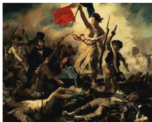
Eugène Delacroix (Charenton-Saint-Maurice, 1798-Paris, 1863), La liberté guidant le peuple , 1830 - Louvre.