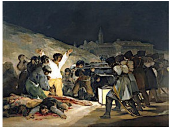
Francisco Goya (Fuendetodos, 1746- Bordeaux, 1828), Le 3 mai 1808 -1814 Prado.

L' indice di vecchiaia = l'indice de vieillissement