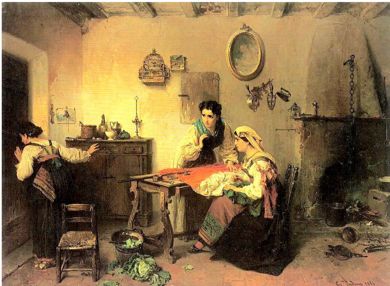
Gerolamo Induno (Milano, 1825-1890), La bandiera nazionale (Roma, 1863) - 1863.