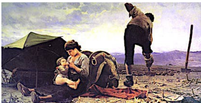
Patini Teofilo (Castel di Sangro, 1840-Naples, 1906), Vanga e latte (Bêche et lait) -1893-4, Roma.