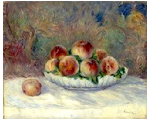
Auguste Renoir (Limoges, 1841-Cagnes-sur-Mer, 1919), Pêches - 1881-82 , Musée de l'Orangerie, Paris.