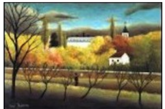
Henri Rousseau (Laval, 1844-Paris, 1910), Le verger - 1886, Nagano (Japon).