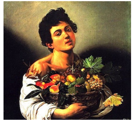
Caravaggio (Milan, 1571-Porto Ercole, 1610), Bacchus avec un panier de fruits - 1593, Galerie Borghese, Rome.