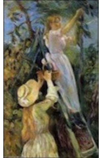
Berthe Morisot (Bourges, 1841-Paris, 1895), Le cerisier - 1891 , Musée Marmottan-Monet, Paris.

L' ananas = l'ananas. L' avocado = l'avocatier et l'avocat Il cachi = le kaki. Il cedro = le cédratier // le cédrat. Il cocco = le cocotier // la noix de coco. Il fico = le figuier // la figue. Il ficodindia = le figuier de Barbarie // la figue de Barbarie. Non vale un fico secco = il ne vaut pas un clou. La fràgola = le fraisier // la fraise. Il kiwi = le kiwi Il lampone = le framboisier // la framboise. Il limone = le citronnier // le citron. Il mango = le manguier // la mango = la mangue Il mandarino = le mandarinier // la mandarine. La mirabella = le mirabellier // la mirabelle Il mirtillo = la myrtille // la myrtille, l'airelle. Il nefèlio = le litchi Il noce = le noyer // la noce = la noix. Il pistacchio = le pistachier // la pistache. Il pompelmo = le pamplemoussier // la pamplemousse. Il ribes (inv.) = le groseillier // la groseille. Il tamarindo = le tamarinier // le tamarin. L' uva spina = le groseillier à maquereau // la groseille à maquereau.