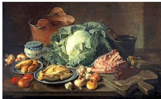
Giacomo Ceruti detto il Pitocchetto (1698-1767), Natura morta con verza , vers milieu XVIIIe s.