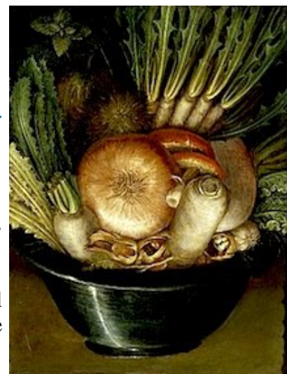
Giuseppe Arcimboldo, L'Ortolano - 1587-90, Cremona. Tableau réversible, cf.ci-dessous.