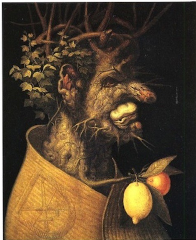
Giuseppe Arcimboldo (1526-1593), Les saisons - 1563-1573, Louvre et Prague.