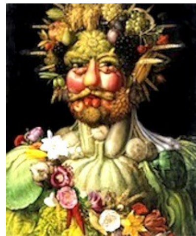
Giuseppe Arcimboldo, Le jardinier (Rodolphe de Habsbourg) -1573, Stockholm

Il finocchio = le fenouil, l'aneth. Surtout dans le centre de l'Italie, le mot a le sens d'« homosexuel masculin » (terme péjoratif).