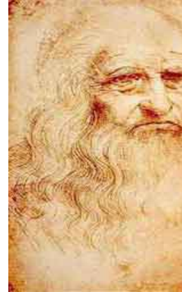
Leonardo da Vinci (Vinci, 1452-Amboise, 1519), Autoritratto, sanguine - 1517, Torino.