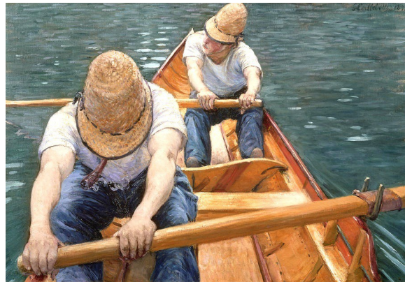
Guillaume Caillebotte (Paris, 1846-Gennevilliers, 1894), Canotiers ramant sur l'Yerres - 1877-79, Coll. privata.