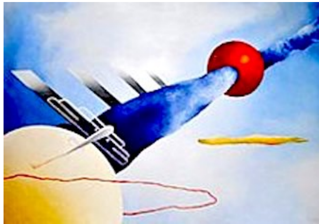
Fillia(Luigi Colombo) (Revello, 1904-Torino, 1938), Mistero aereo - 1930-31, Trento.

-0-0-0-0-0-0-0-0-0-0-0-0-0-0-0-0-0-0-0-0-0-0-0-