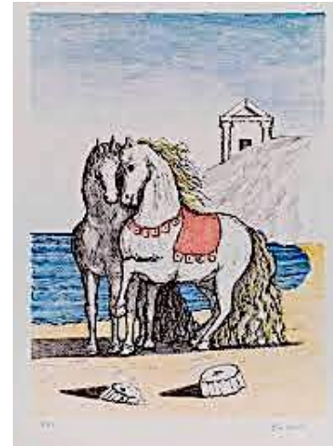
Giorgio de Chirico (Vòlos, 1888-Roma, 1978), Cavalli con gualdrappa rossa (Chevaux avec caparaçin rouge rouge) -1972, Lithographie à 7 couleurs.