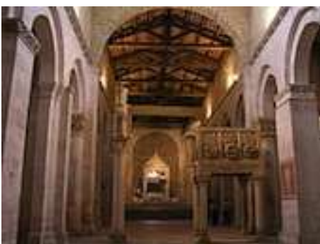
Abbaye de San Clemente a Casauria : la façade, la lunette du portail central, un détail de la lunette, l'intérieur à trois nefs

ensemble de « castra », centres fortifiés autour d'un château, première forme d'aristocratie foncière féodale. C'est aussi le temps où se construisent les grandes abbayes, comme Saint Clément a Casauria , créée en 871 entre Pòpoli et Chieti par un petit-neveu de Charlemagne, plusieurs fois endommagée (la dernière fois par le tremblement de terre de 2009) et restaurée dans un style intermédiaire entre le roman et le gothique cistercien. « Casauria » est dérivé du nom du temple romain antérieur : « casa aurea » ou « casa « Urii » ( Urios = une des formes de Jupiter). Les restes de S. Clément, pape et martyr, furent transportés dans cette abbaye en 872. Sur la lunette du portail, on voit S. Clément ayant à sa droite les saints Fabius (soldat