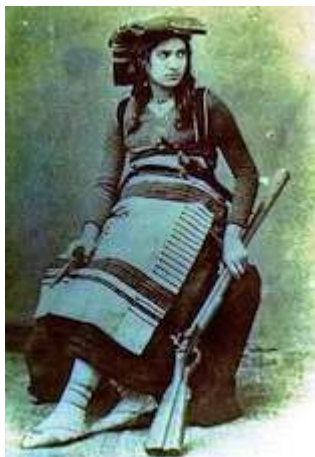
Une « brigantessa »

plus violentes fut la Bande de la Maiella de Angelo Camillo Colafella di Sant'Eufemia, Pasquale Mancini (« Mercante »), Domenico Valerio d'Atessa (« Cannone », le bandit des moulins), Giovanni Di Sciascio, Salvatore Scenna et Nicola Marino, active jusqu'en 1868. On peut citer encore la Bande de Croce di Tola , dit « Crocitto » dans la vallée de Peligna, capturée en 1871. Fabiano Primiano Marcucci fut aussi capturé en 1871, condamné à mort puis aux travaux forcés, libéré en 1911, où il fut accueilli par toute la population de son village. Sur le Mont Sirente, il y avait eu au début du siècle la bande de Gaetano Mammone (1756-1802), qui resta un héros populaire dont on utilisait le nom pour faire peur