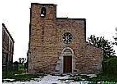
S. Maria ad Vicum

Sasso, fondée par le Longobard Didier au VIII e siècle, avec ses fresques du XIII e siècle, l'abbaye de Santa Maria di Faifula , entre