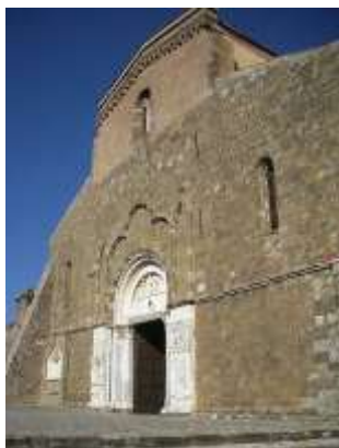
S. Giovanni in Venere

romain d'Algérie et condamné à mort au IV e siècle) et Cornelius (pape en 251 et martyr) et à sa gauche l'abbé Leonate (abbé de 1152 à 1192) montrant l'abbaye qu'il a fait reconstruire. La façade est précédée