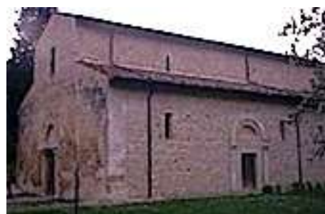
S. Pietro ad Oratorium