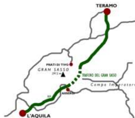
Le Gran Sasso 1) Le Corno Grande, 2) Vue depuis le Campo Imperatore. 3) L'Hôtel Campo

Le Gran Sasso est assorti d'un grand plateau d'une altitude de 1800 mètres, Campo Imperatore . C'est un lieu important pour ses activités sportives et pour son observatoire astronomique (photo ci-contre). C'est à l'Hôtel Campo que Mussolini fut emprisonné en 1943 par le Grand Conseil Fasciste, puis libéré par un commando SS allemand. L'autre grande chaîne du centre est celle de La Maiella (panorama sur la photo page suivante). Quatre de ses monts dépassent les 2500 mètres : le Monte Amaro (2793 m.), I Tre Portoni (2653 m.), Il Pesco Falcone (2657 m.) et le Monte Acquaviva (2737 m.).