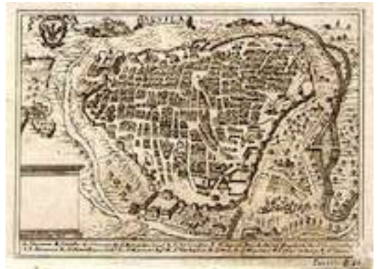
L'Aquila avant le tremblement de terre de 1703

La ville fut encore affaiblie par les épidémies de peste (1349, 1363, 1464, 1424, 1526, 1656) et par les tremblements de terre, dont le plus terrible (après ceux de 1328, 1398, 1456, 1498, 1599, 1646, 1672) fut celui du 2 février 1703, qui fit crouler la totalité de L'Aquila, causant plus de 2000 morts et d'innombrables blessés. En 1712, on ne comptait plus dans la ville que 2659 habitants. La reconstruction en fit une ville baroque d'où la plupart des traces anciennes avaient disparu. Dans les années '70 du XXe siècle, L'Aquila donnait encore l'image d'une ville qui s'était endormie quelques siècles plus tôt.