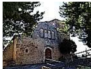
S. Benedetto in Perillis

D'autres abbayes sont construites à la même époque, celle de Corròpoli , la Badia Morrone , sur laquelle l'ermite Pietro Angeleri da Isernia (le futur pape Célestin V, celui qui fit « le grand refus », démissionnant de sa fonction de pape au bout de 5 mois) installa au XIII e siècle le siège de l'ordre des Célestins, l'abbaye de San Bartolomeo , de 962, sur le Gran Sasso, San Giovanni in Venere (Photo à gauche), du VIII e siècle, vers Ortona, une des plus importantes des Abruzzes, le monastère de San Benedetto in Perillis (Photo à droite), du VIII e -IX e