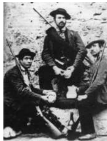
Brigands dans les Abruzzes