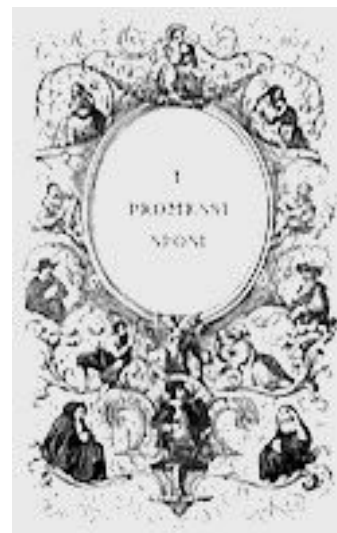
I promessi sposi , édition de 1840

Du Seicento au milieu du Settecento, le « voi » et le « Lei » se maintiennent interchangeables, tandis que l'on emploie le « Ella » pour les personnages très importants. Mais le « lei » est combattu par beaucoup parce que ressenti comme d'origine étrangère, et jusqu'au début du Novecento, la langue oscille entre les deux formes « Lei / Ella » et « voi ». Il y a aussi des usages différents entre le Nord jusqu'à une ligne Ancona-Roma qui emploie le « tu » et le « lei », et le sud qui privilégie le « tu » et le « voi ».