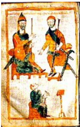
Charlemagne et Pépin le Bossu - Annales de Fulda -X e siècle.

Au Quattrocento, on maintient le « tu », mais on dit « voi » aux personnes importants : elles comptent pour deux ou pour plusieurs et on emploie donc le pluriel, et le « Lei » (dont l'existence est attestés dès le XIII e siècle, usage ancien d'accorder le pronom avec l'entité abstraite comme dans Vostra Signoria ) commence