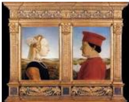
Piero della Francesca, Le duc d'Urbin et Battista Sforza, 1470-73

À partir du Cinquecento, surtout sous l'influence de l'aristocratie et de l'Inquisition espagnoles, le « Lei »