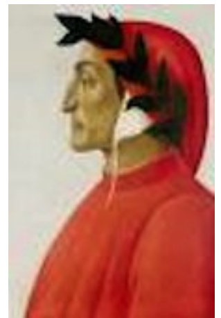
Botticelli -Dante, 1495 - Genève