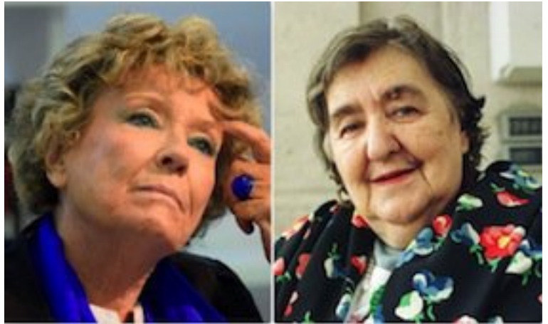
Dacia Maraini et Alda Merini